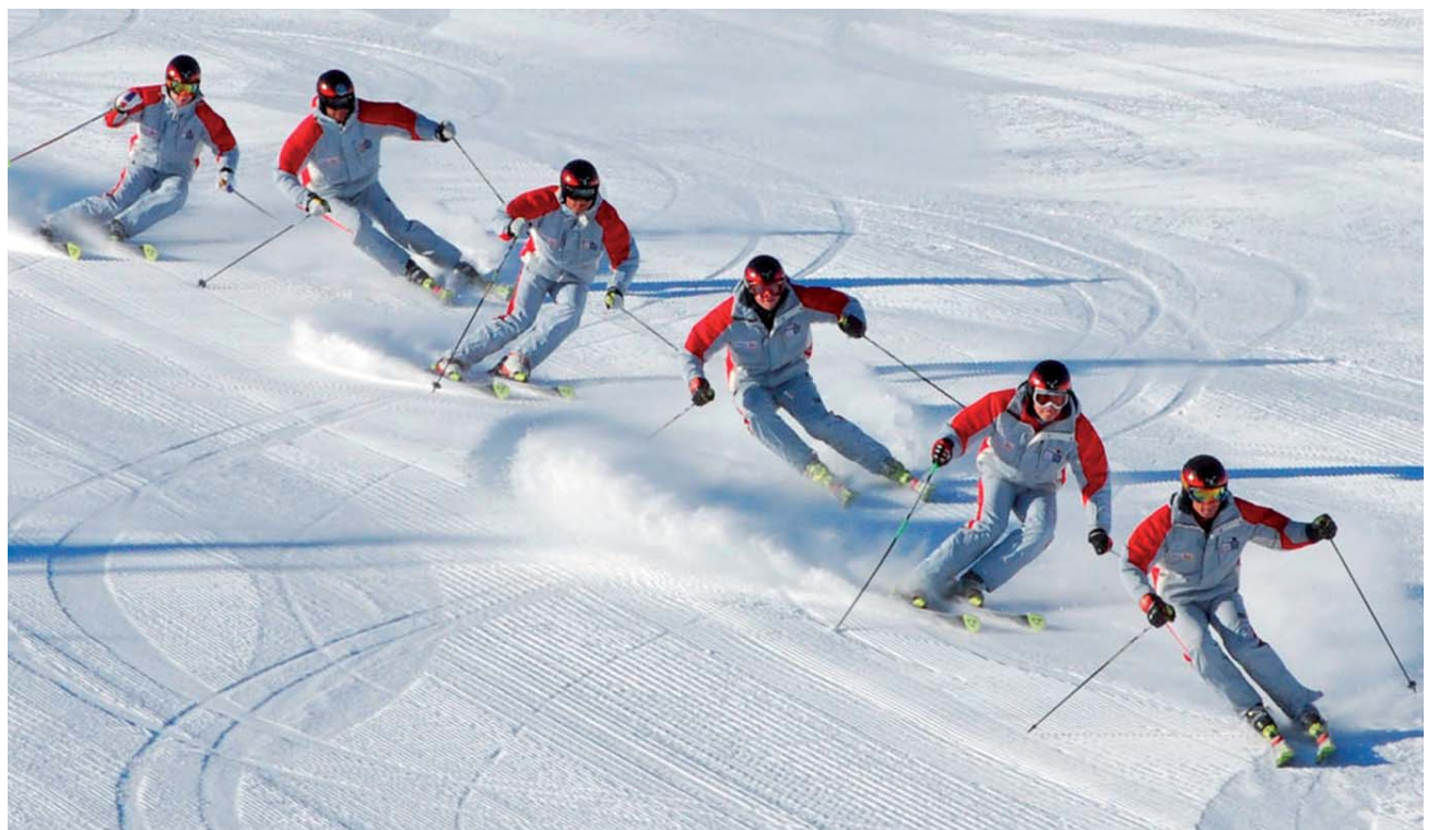
Vizeweltmeister - Team „ING SnowSportAcademy Fieberbrunn

Die ISIA-Weltmeisterschaften 2009 fanden vom 2. bis 7. März 2009 in Maribor (Slowenien) statt.