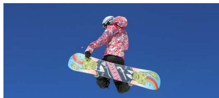
Big Air - Big-Air-Contest für Ski und Snowboard.

Gewinnen kann nur, wer eine aggressive Linie mit spektakulären Sprüngen, aber dennoch eine kontrollierte und flüssige Fahrt zeigt.